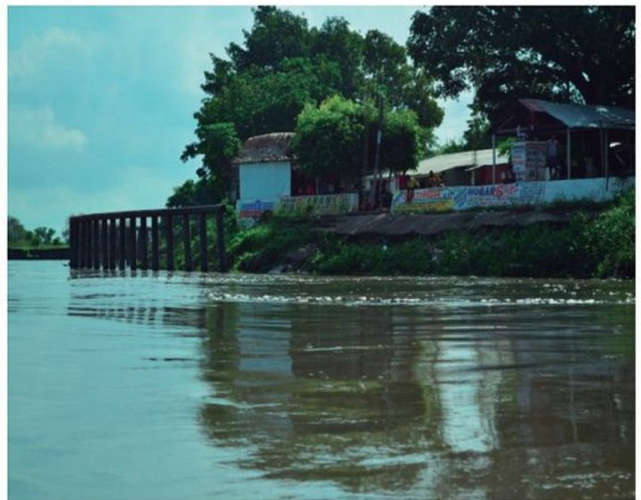
Puerto entrada a San Martín

Pensar y sentir la música tradicional de nuestros pueblos rurales nos lleva a darnos cuenta de la complejidad de sus contenidos y formas propias, es decir, a entender su existencia, su formación y su permanencia, lo cual nos acerca a nuestra historia política y social del país. Una mezcla histórica de culturas entrelazadas a través del proceso violento de la colonización y de la esclavitud, trajo consigo expresiones de resistencia endógena, apropiación de la tierra por parte de las comunidades que se fueron asentando en las regiones entre el río Magdalena y la Serranía de San Lucas, comunidades que a partir de ideales de libertad emprendieron caminos por la espesura de la Depresión Momposina.