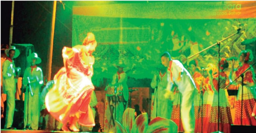
Grupo Juventud Sanmartinense

De esta manera los y las hijas de negros esclavizados, de las y los indígenas atropellados y de las y los blancos foráneos resguardaron en su cultura música de emancipación, de fiesta, de alegría; hicieron de los tambores un instrumento de guerra en tiempos de zozobra política; enfrentaron con sus voces y sus cuerpos el abandono de los poderes oficiales; con sus cantos y danzas recrearon su mundo, su entorno, representando los mitos y leyendas del pasado encarnado en la naturaleza, en las ciénagas, en los montes, caños y riachuelos.