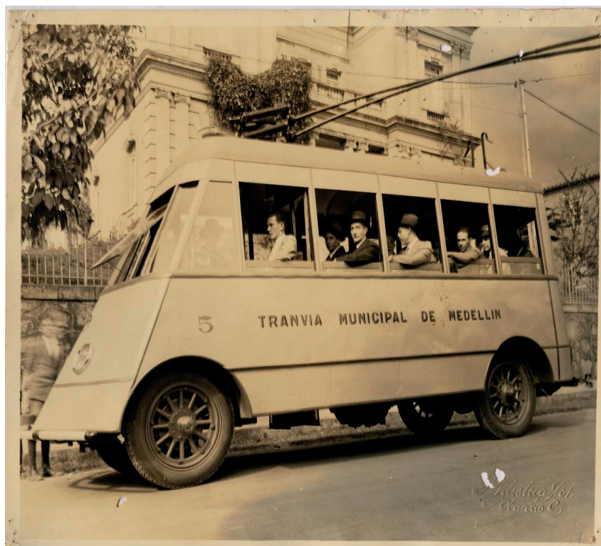
Figura 3. Universidad Nacional de Colombia, Sede Medellín, “Tranvía Municipal de Medellín”.