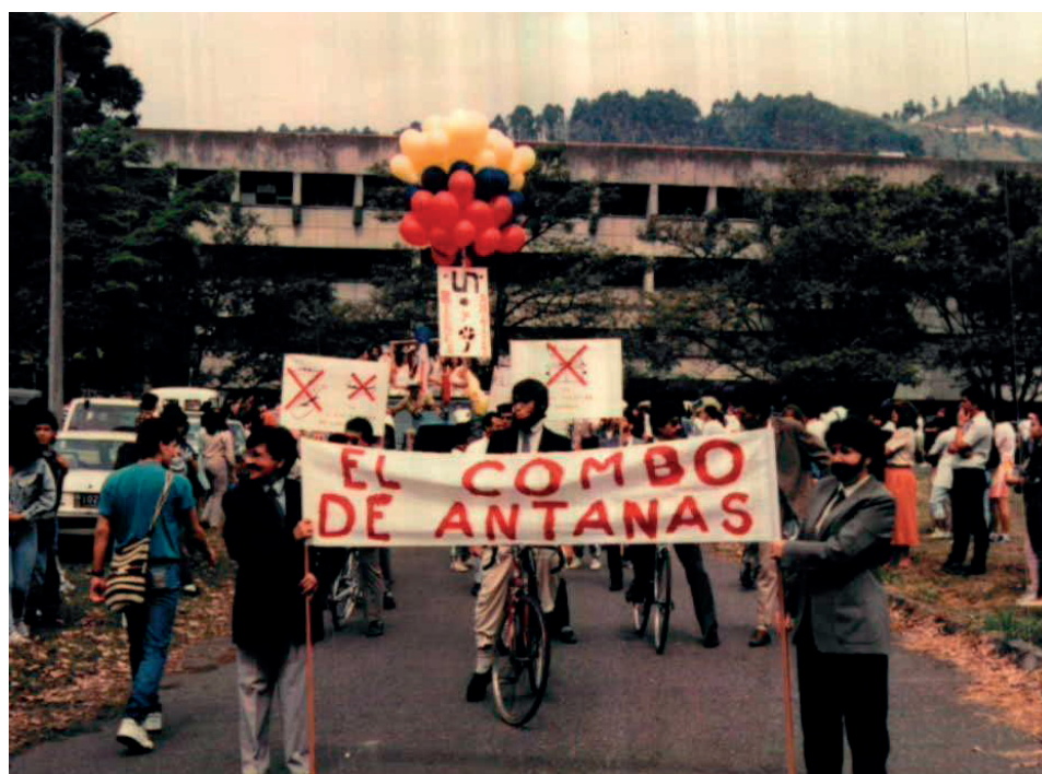
Figura 2. Universidad Nacional de Colombia sede Medellín, “El Combo de Antanas”.